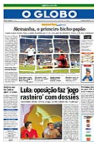
JORNAL "O GLOBO"