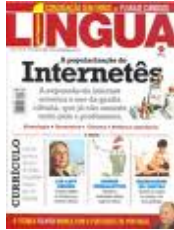
REVISTA LÍNGUA PORTUGUESA