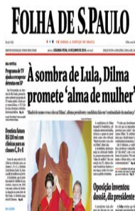
FOLHA DE SÃO PAULO