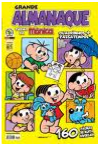
ALMANAQUES TURMA DA MÔNICA