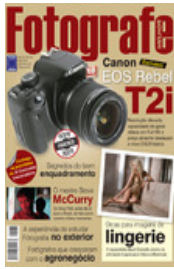
REVISTA FOTOGRAFE MELHOR