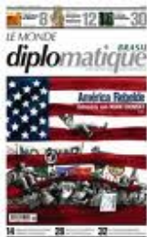
LE MONDE DIPLOMATIQUE BRASIL