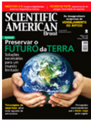
SCIENTIFIC AMERICAN BRASIL