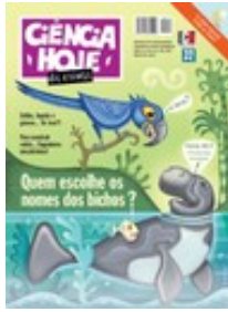
REVISTA CIÊNCIA HOJE DAS CRIANÇAS