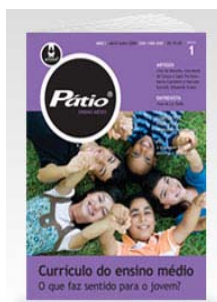
PÁTIO ENSINO MÉDIO