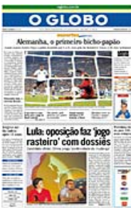
JORNAL "O GLOBO"