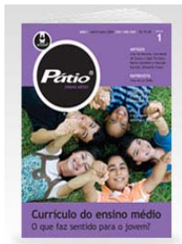
PÁTIO REVISTA PEDAGÓGICA