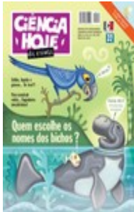
CIÊNCIA HOJE DAS CRIANÇAS