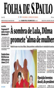
FOLHA DE SÃO PAULO