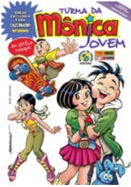
REVISTA TURMA DA MÔNICA