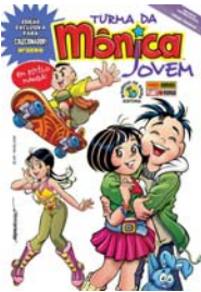
REVISTAS DA TURMA DA MÔNICA