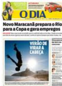
JORNAL "O DIA"