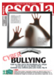
REVISTA NOVA ESCOLA