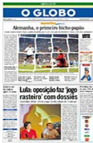
JORNAL "O GLOBO"