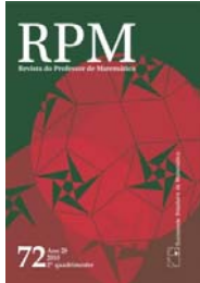
REVISTA DO PROFESSOR DE MATEMÁTICA