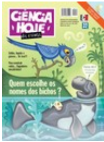
CIÊNCIA HOJE DAS CRIANÇAS