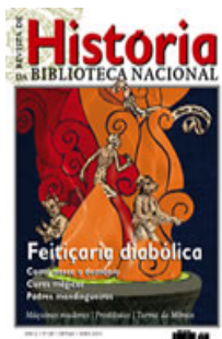
REVISTA DA BIBLIOTECA NACIONAL