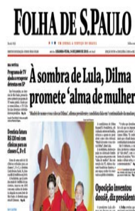
FOLHA DE SÃO PAULO