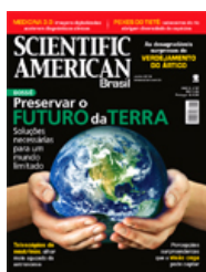
REVISTA SCIENTIFIC AMERICAN