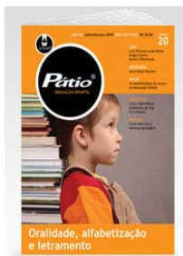
PÁTIO EDUCAÇÃO INFANTIL