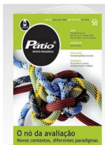
PÁTIO REVISTA PEDAGÓGICA