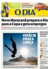
JORNAL "O DIA"